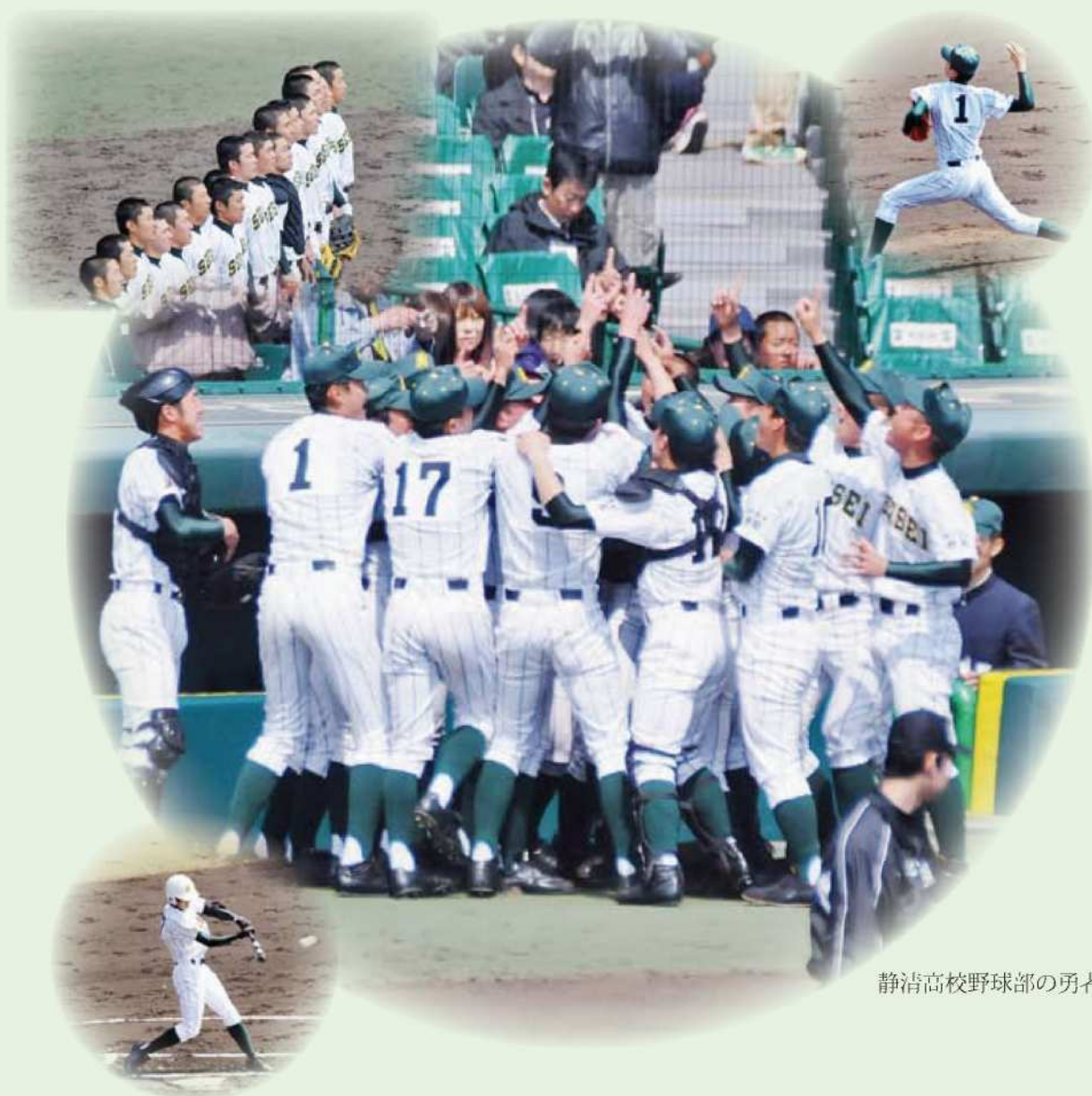
静清高校野球部の勇者たち