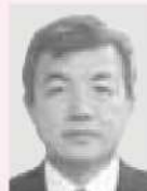
常任理事 株丸 川 見崎 成